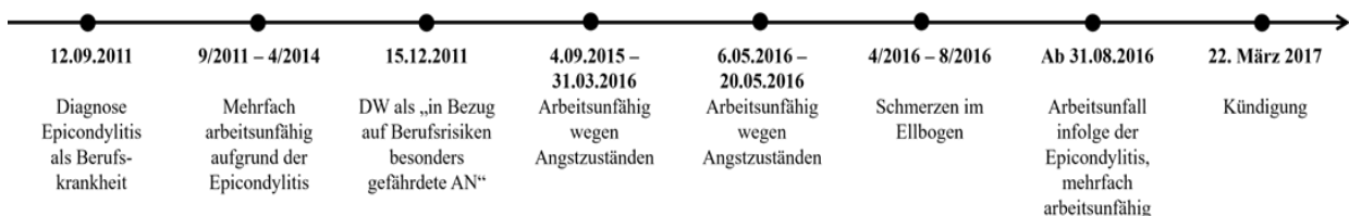
Abb 2: Krankheitsbedingte Fehlzeiten der DW (2011 - 2017)

„geeignete Maßnahmen zu ergreifen, um den Arbeitsplatz und die Zugänglichkeit des Unternehmens den Erfordernissen jeder konkreten Situation anzupassen, damit Menschen mit Behinderung Zugang zur Beschäftigung erhalten, ihre Arbeit erledigen, beruflich vorankommen und Zugang zur Fortbildung erhalten können, es sei denn, diese Maßnahmen stellen für den Arbeitgeber eine unverhältnismäßige Belastung dar.“