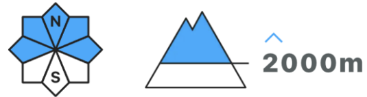
Abbildung 2: Piktogramme zu Exposition und Höhe der Gefahrenstellen 6